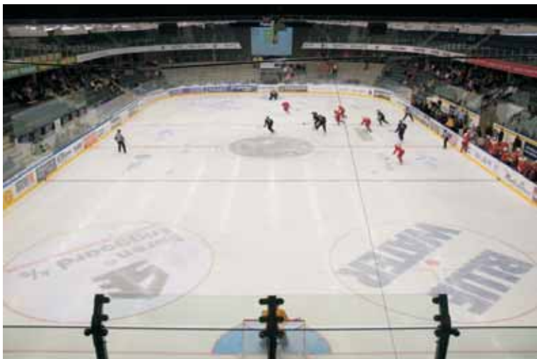
▲ Billede fra Danmarks største skøjtebane, GIGANTIUM, med plads til 5.000 tilskuere. Anlægget er affugtet af Cotes affugtere.

It's in the air ... ... quality does indeed make a difference!